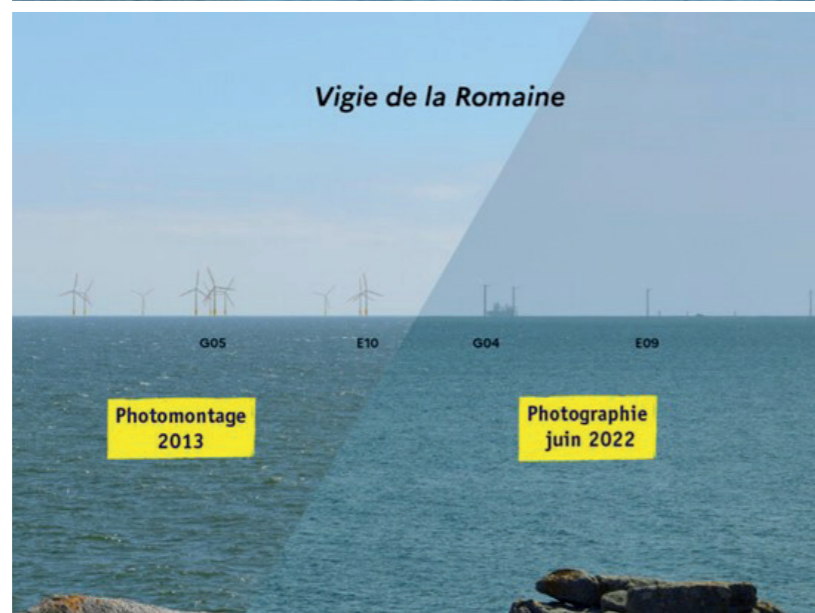
Comparaisons à Saint-Nazaire : photomontage / réel (environ 17 km)